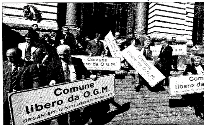
Le targhe che saranno affisse all'ingresso dei comuni Ogm-free

Naples: Chamber of Commerce (October 2004)